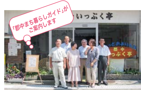
▲「郡中まち暮らしガイド」は郡中のまちを愛し、暮らしを楽しむまち暮らしのプロ。郡中のことならなんでもお聞きください。

〒799-3113 愛媛県伊予市米湊827番地4 TEL.089-946-7245 FAX.089-946-7241 http://www.machidukuri-gunchu.jp/